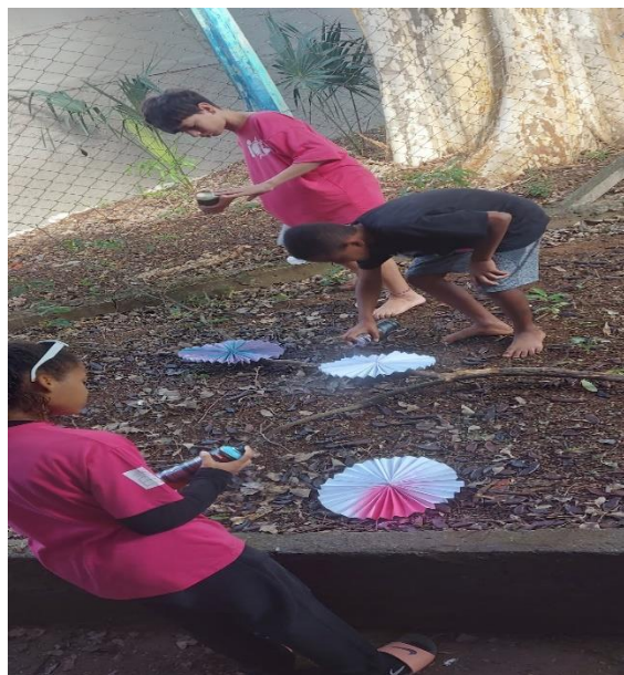
Atividades: Ponto de arrecadação de donativos e construção dos enfeites