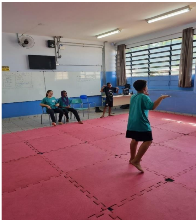
Atividade: Transformando a Cena