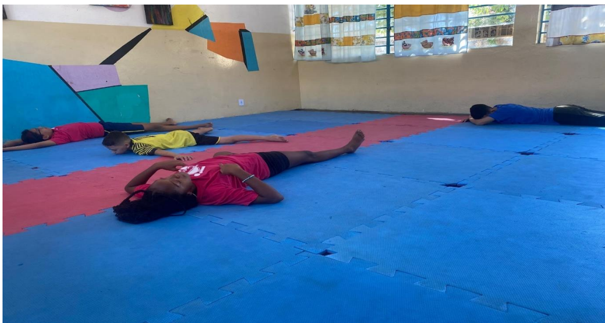
Momento de relaxamento