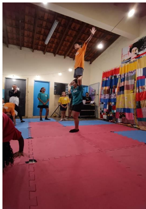
Apresentação no Sarau do Pontinho de Cultura