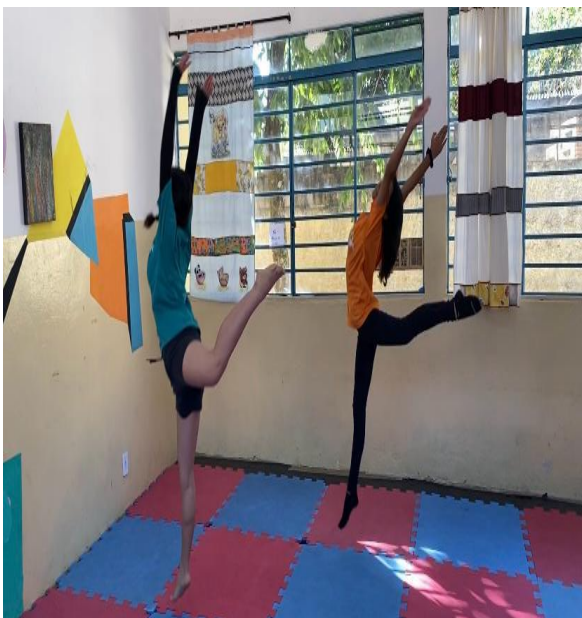
Treino de saltos