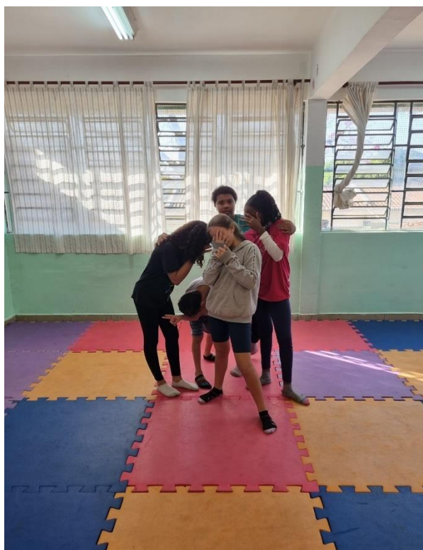
Atividade: Estátua ABC (Manhã)