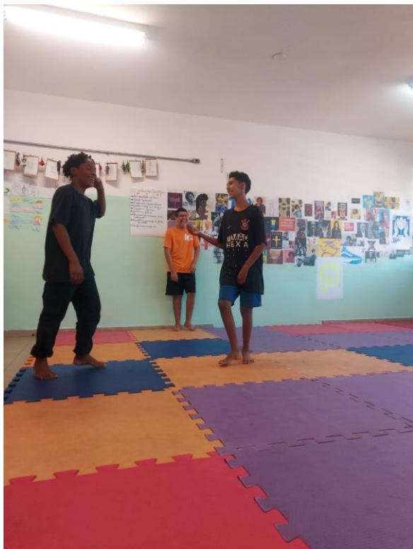
Atividade: Jogo do Troca (Tarde) /