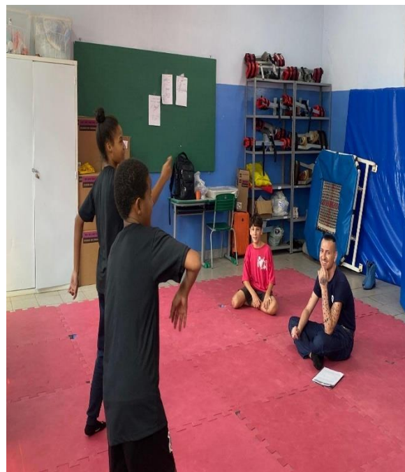
Exercício teatral de improvisação