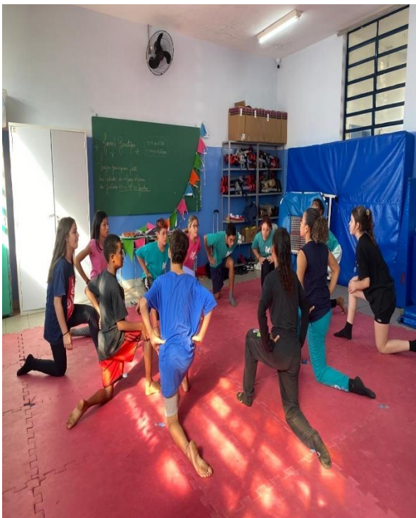
- Exercícios de mobilidade