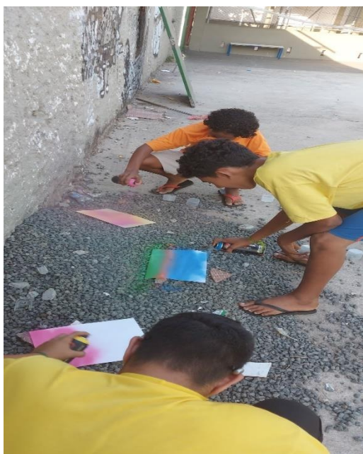
Atividade com tinta splay