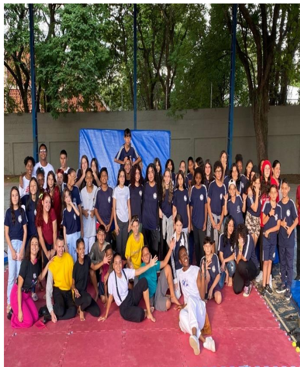
- Intervalo Cultural