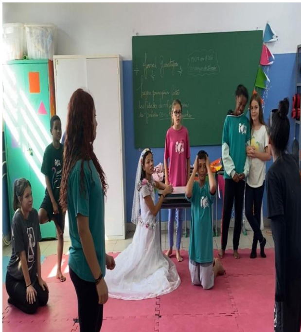
Ensaio do “casamento caipira”