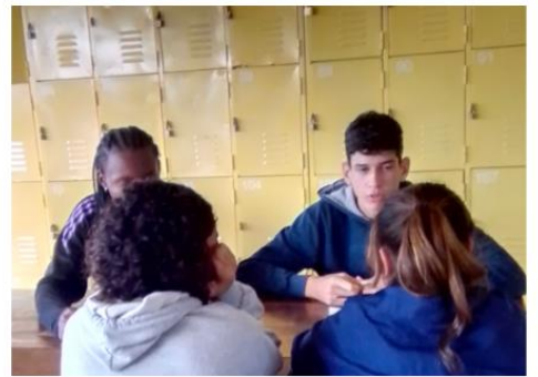
Oficinas Papo Reto