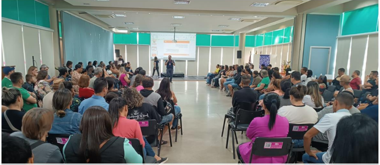
Reunião de Famílias 17/05