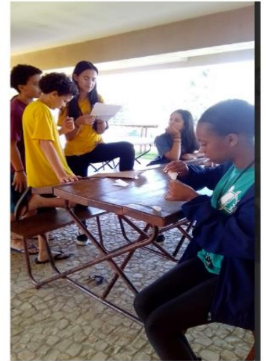
Oficinas Papo Reto