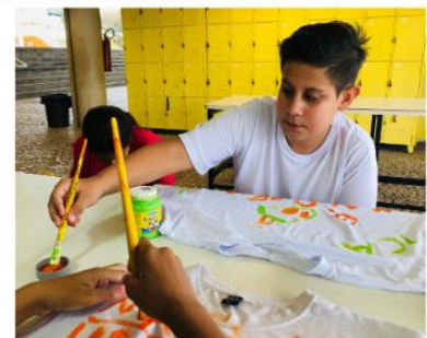
Oficinas Papo Reto