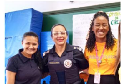
Formação Assessoria técnica Papo Reto – Universo Virtual – Vulnerabilidade na era digital – Equipe Interna 29/05