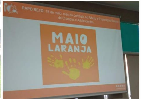
Formação Assessoria técnica Papo Reto – Orientação sobre atendimento a vítimas de violência sexual e demais violências – aberto para a rede. 26/05/2025