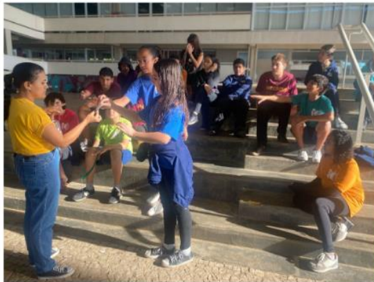
Oficinas Papo Reto